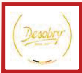
Desobry (Tournai) Biscuiterie