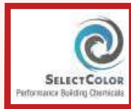
SelectColor (Herve) Fabrication de peintures, résines, enduits